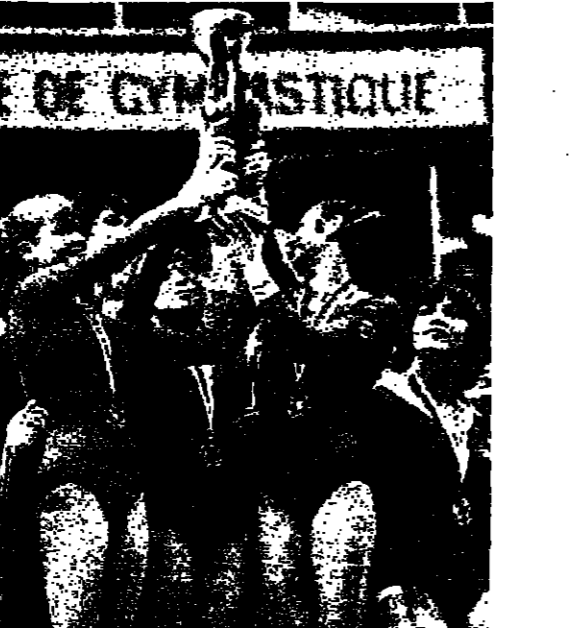
السوفييات في الوسط ثم الالاتية التي يمتحن والهنغرات الى اليسار

السوفييات تزن بطولة العالم بالمجموع الاول ان الامنيات الاكثبات الوارثي حلان في المربة الثانية استلمن لقب التتار هن ايضا تجمال ادانهن واتقاة حركاتهن . في الصورة الاولى الالاتية الخيطرية اتجنتا جيلان تودي حركات حرة على التوازي الخلف الارتفاع ومع روعة عرضها ، فقد تكلمت انجيلكا من احرار الميدالية البرونزية فقط . وفي الصورة الثانية تبدو حركات الميدالية وهن : السوفييات في الوسط ثم الالاتية التي يمتحن والهنغرات الى اليسار .